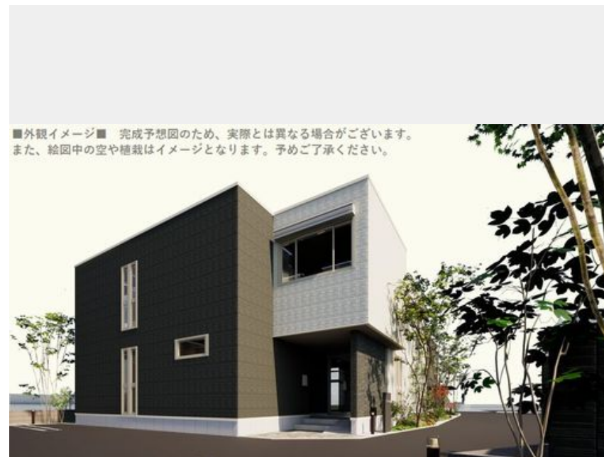
■外観イメージ■ 完成予想図のため、実際とは異なる場合がございます。また、絵图中的空や植栽はイメージとなります。予めご了承ください。