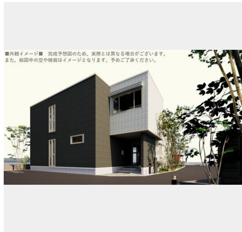
■外観イメージ■ 完成予想図のため、実際とは異なる場合がございます。また、絵图中的空や植栽はイメージとなります。予めご了承ください。