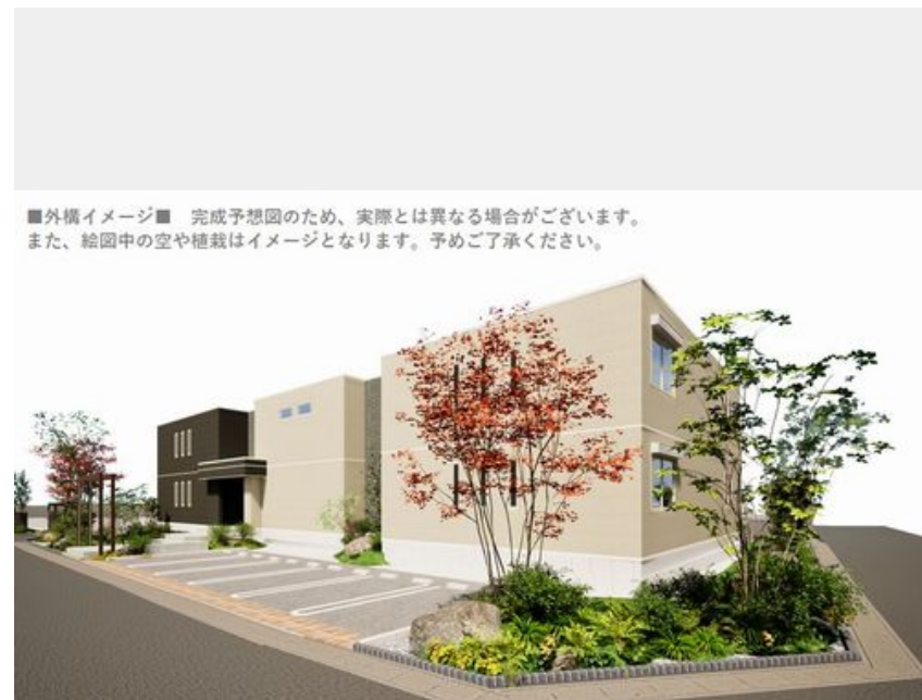
■外構イメージ■ 完成予想図のため、実際とは異なる場合がございます。また、絵图中的空や植栽はイメージとなります。予めご了承ください。