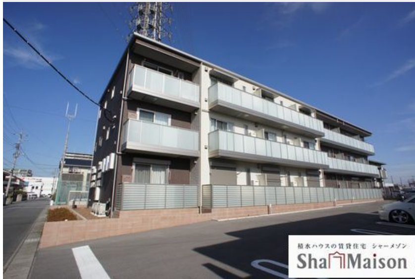
積水ハウスの賃貸住宅 シャーメゾン Sha Maison