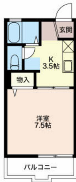
積水ハウスの賃貸住宅 シャーメゾン