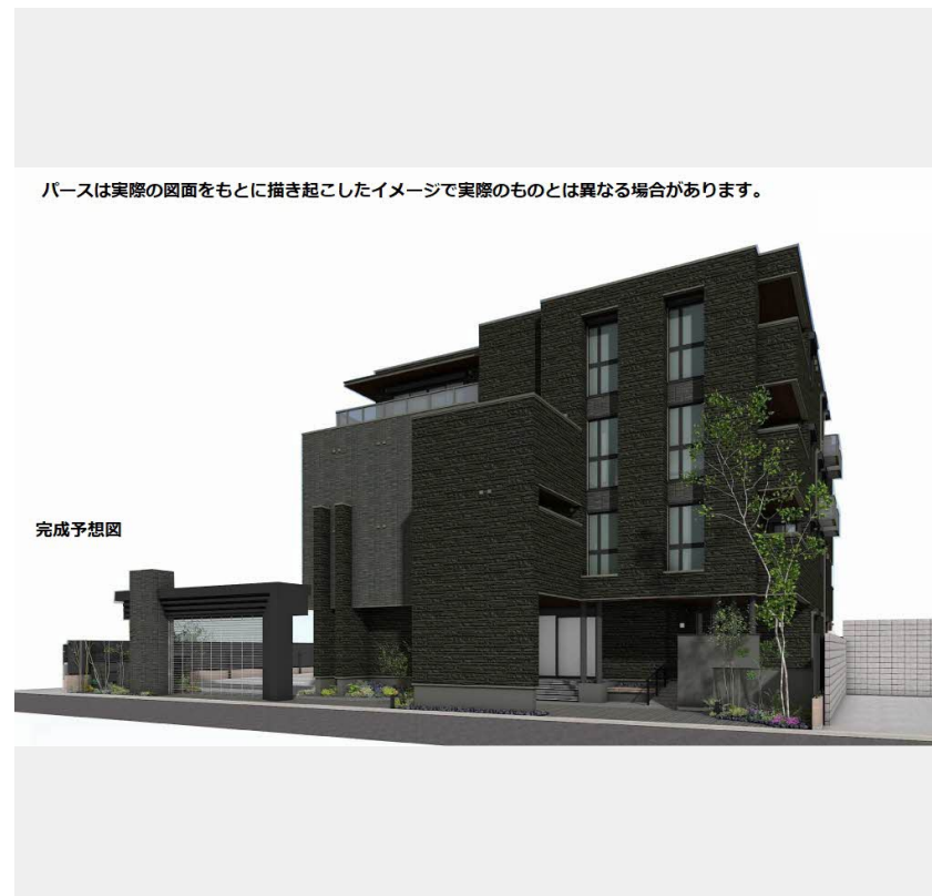
パースは実際の図面をもとに描き起こしたイメージで実際のものとは異なる場合があります。