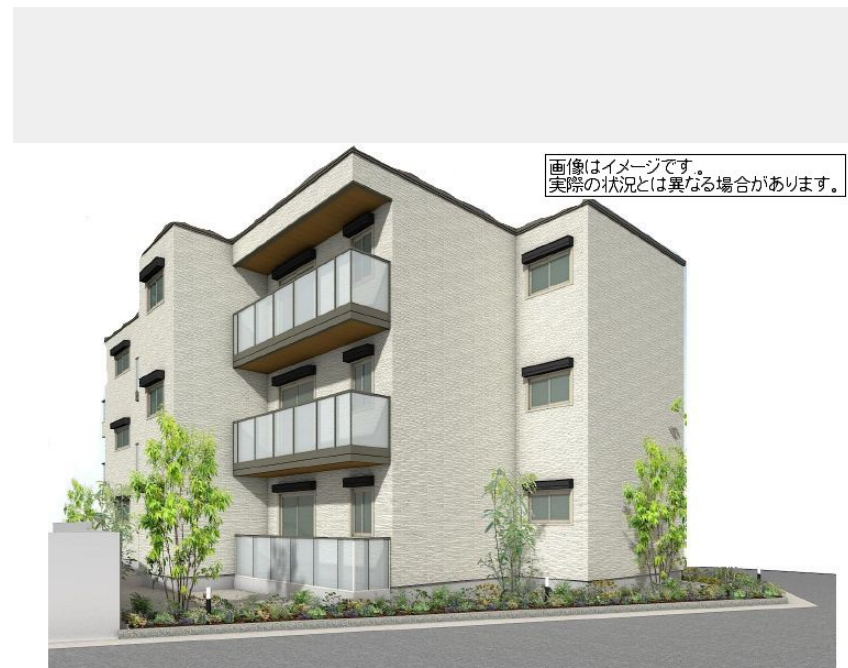
画像はイメージです。実際の状況とは異なる場合があります。