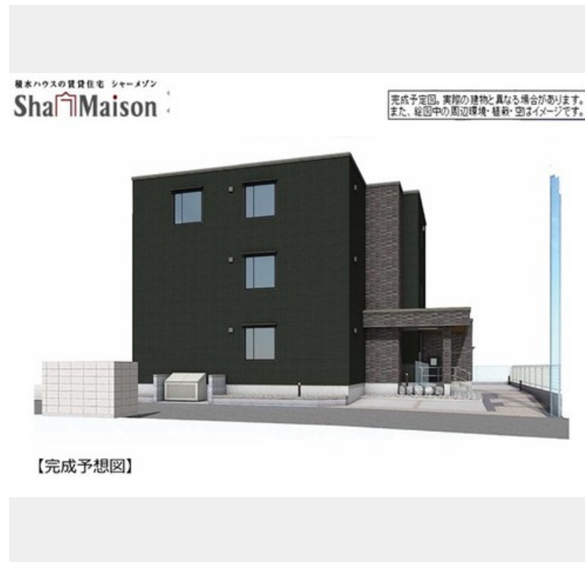
完成予定図。実際の建物と異なる場合があります。また、絵図中の周辺環境・植栽・空はイメージです。