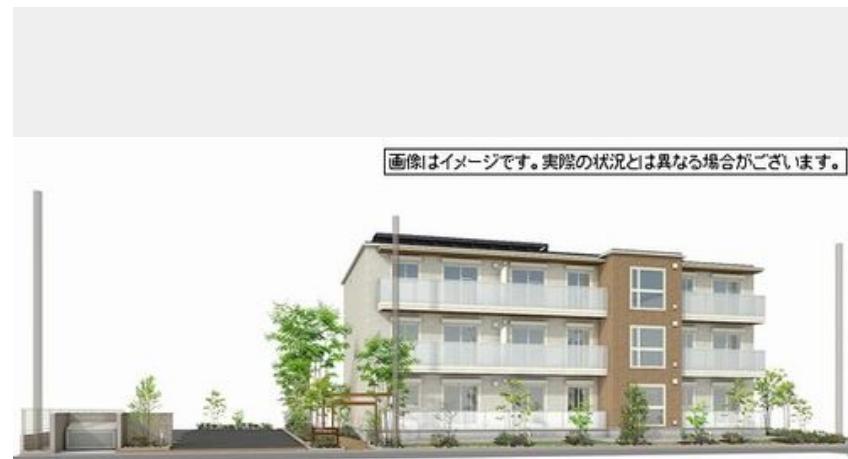
画像はイメージです。実際の状況とは異なる場合がございます。