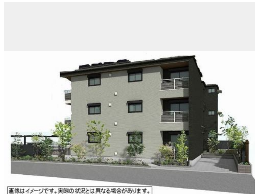
画像はイメージです。実際の状況とは異なる場合があります。