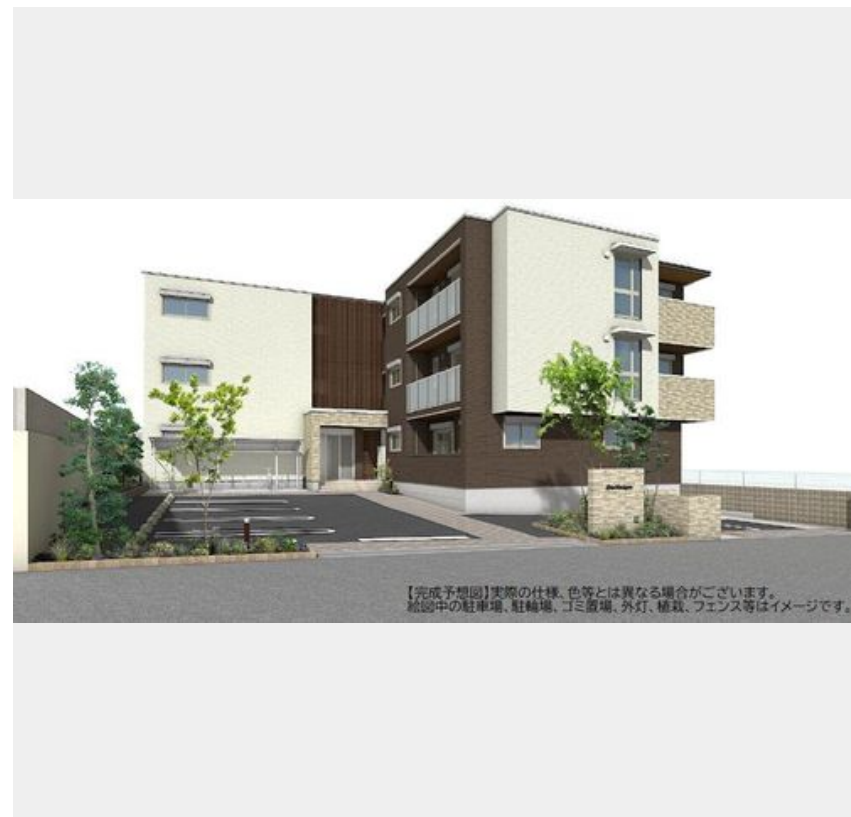
【完成予想図】実際の仕様、色等とは異なる場合がございます。 植込みの駐車場、駐輪場、ゴミ置場、外灯、植栽、フェンス等はイメージです。