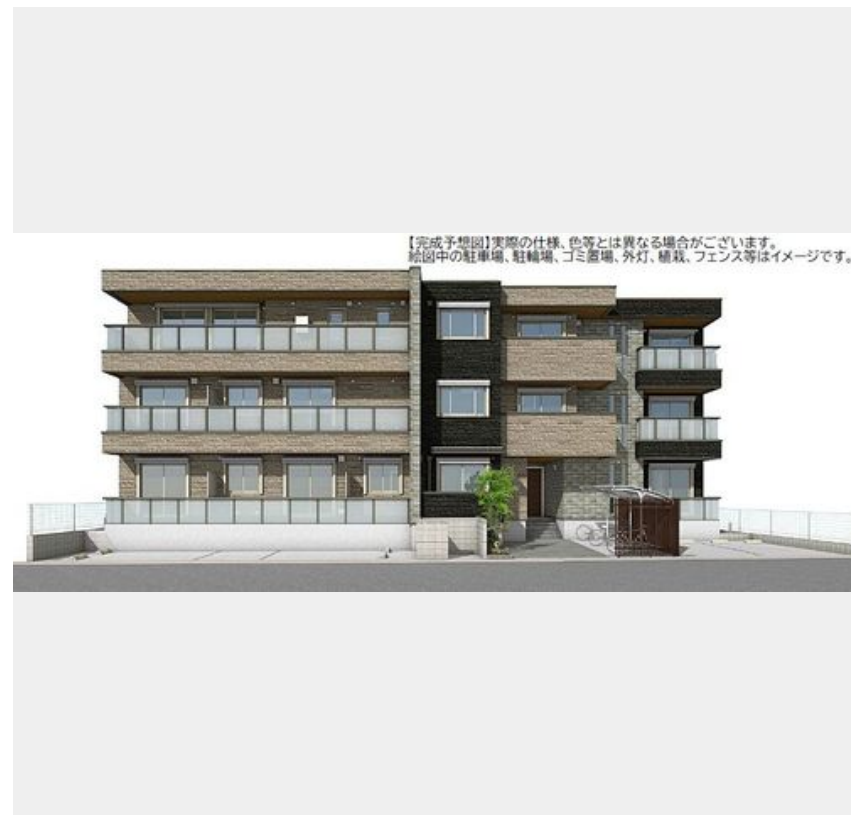
【完成予想図】実際の仕様、色等とは異なる場合がございます。図中の駐車場、駐輪場、ゴミ置場、外灯、植栽、フェンス等はイメージです。