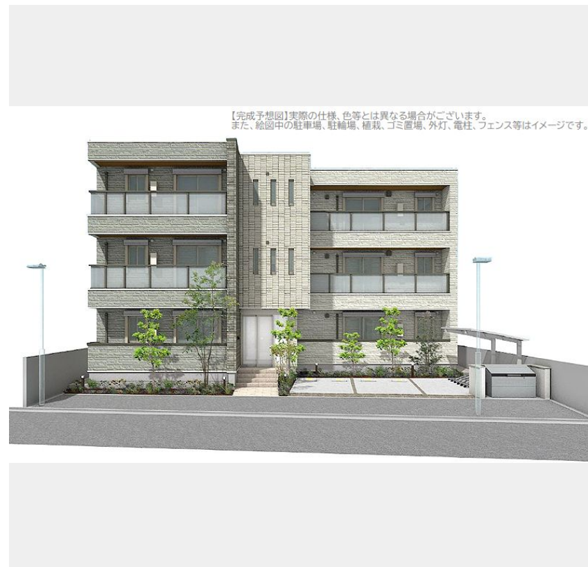
【完成予想図】実際の仕様、色等とは異なる場合がございます。また、絵画中の駐車場、駐輪場、植栽、ゴミ置場、外灯、電柱、フェンス等はイメージです。