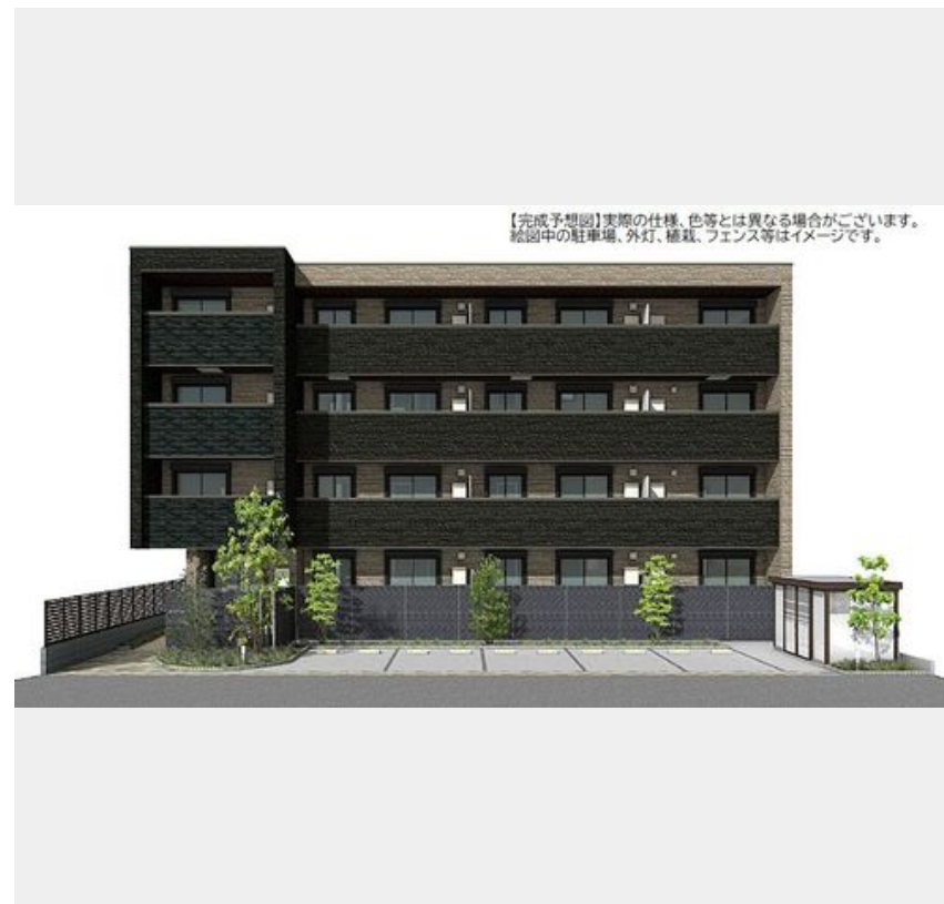
【完成予想図】実際の仕様、色等とは異なる場合がございます。結句中の駐車場、外灯、植栽、フェンス等はイメージです。