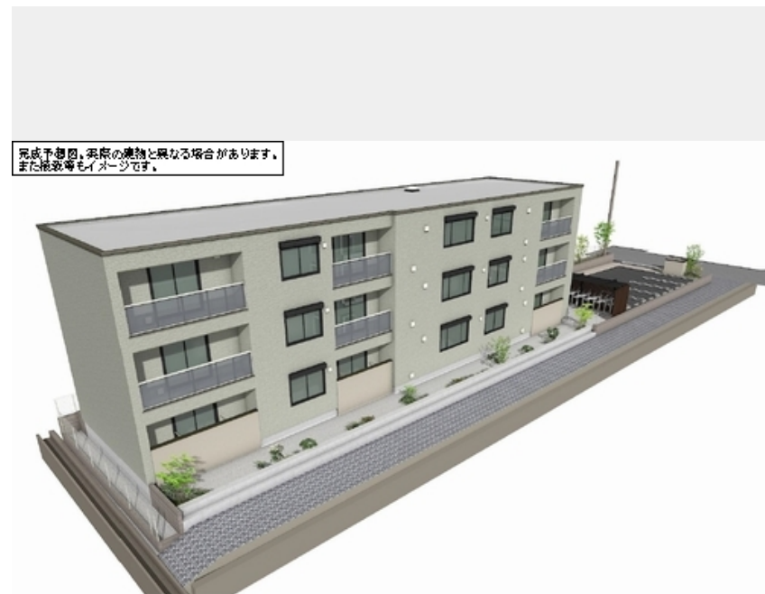
完成予想図。実際の建物と異なる場合があります。また掲載イメージです。