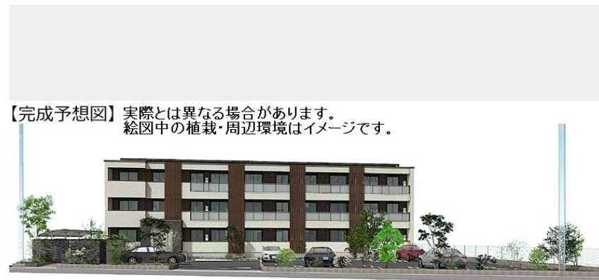
【完成予想図】実際とは異なる場合があります。絵図中の植栽・周辺環境はイメージです。