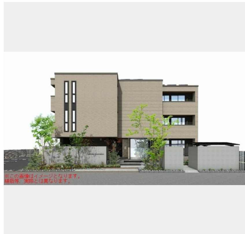
※この画像はイメージとなります。掲載等、実際とは異なります。