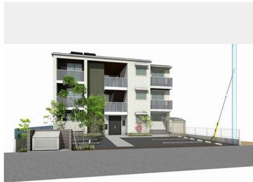
【完成予想図】実際の仕様、色等とは異なる場合があります。