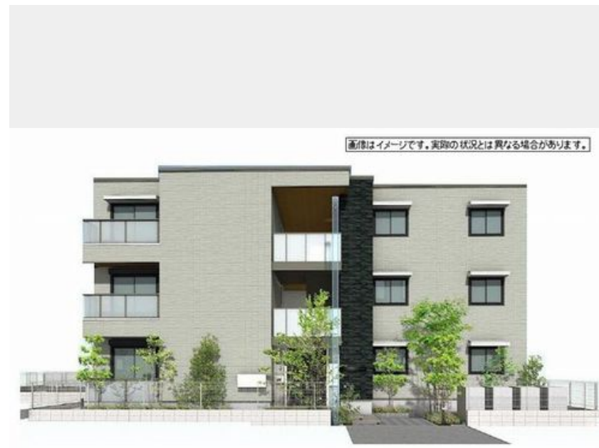
画像はイメージです。実際の状況とは異なる場合があります。