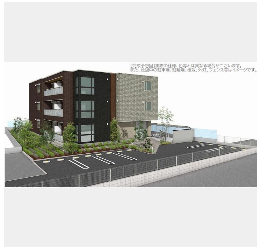
【完成予想図】実際の仕様、色等とは異なる場合がございます。また、絵图中的駐車場、駐輪場、植栽、外灯、フェンス等はイメージです。