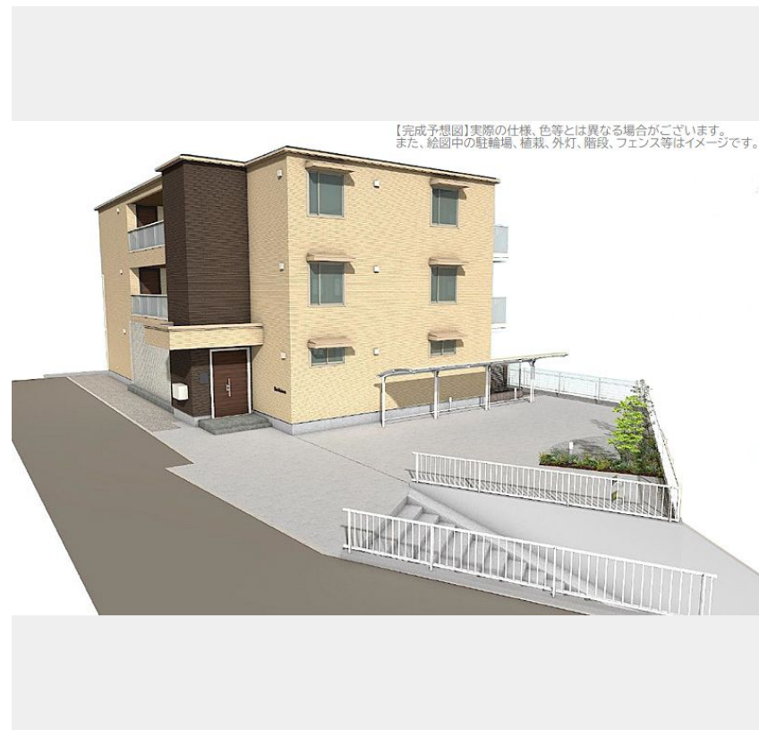
【完成予想図】実際の仕様、色等とは異なる場合がございます。また、絵图中的な駐輪場、植栽、外灯、階段、フェンス等はイメージです。