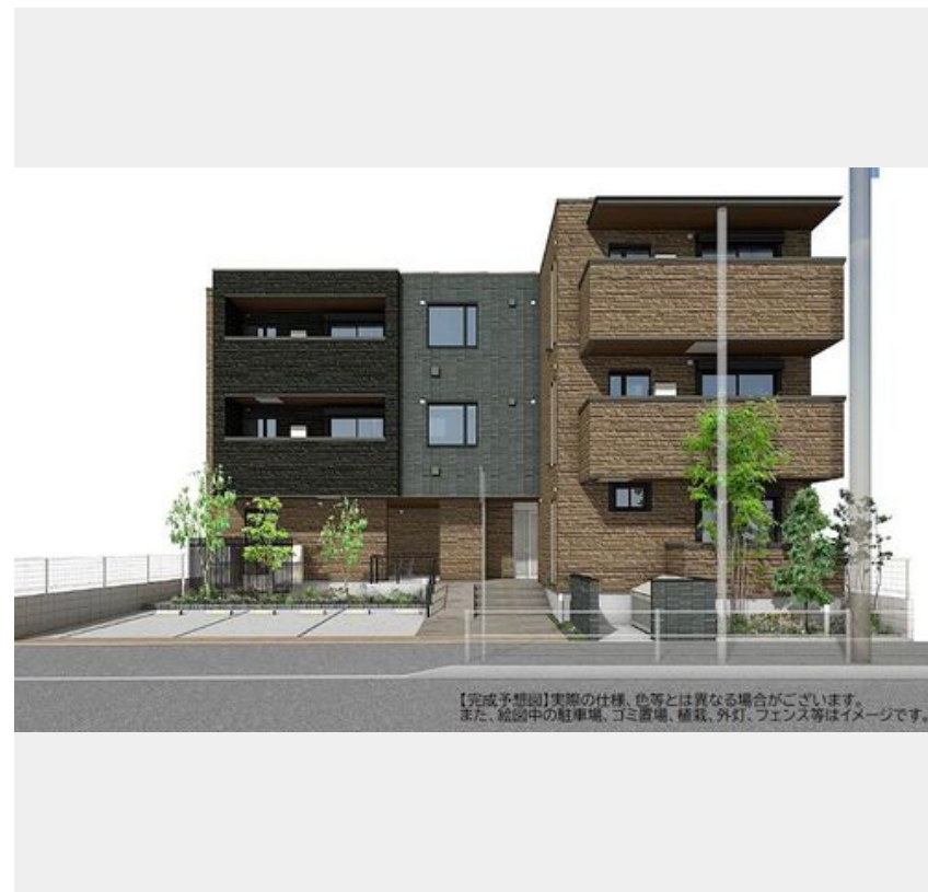
【完成予想図】実際の仕様、色等とは異なる場合がございます。また、絵图中的駐車場、ゴミ置場、植栽、外灯、フェンス等はイメージです。