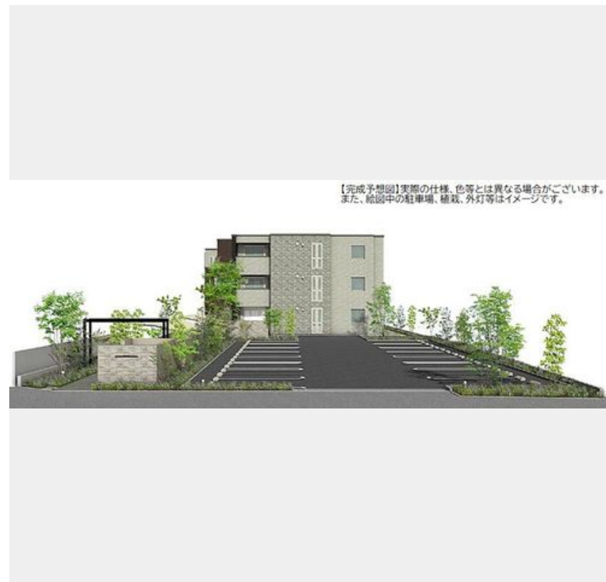
【完成予想図】実際の仕様、色等とは異なる場合がございます。また、給図中の駐車場、植栽、外灯等はイメージです。