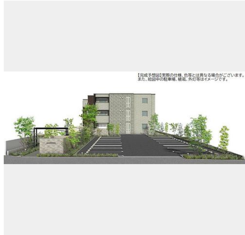
【完成予想図】実際の仕様、色等とは異なる場合がございます。また、絵画中の駐車場、植栽、外灯等はイメージです。