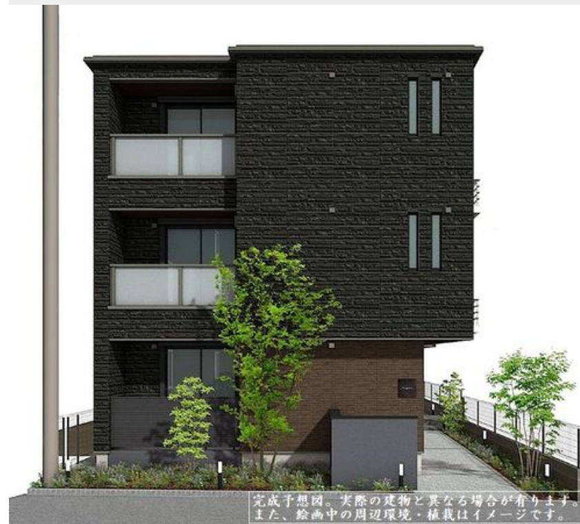
完成予想図。実際の建物と異なる場合があります。また、絵画中の周辺環境・植栽はイメージです。