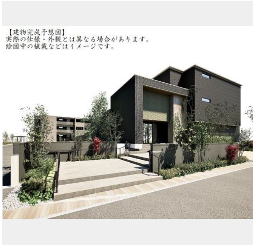
【建物完成予想図】 実際の仕様・外観とは異なる場合があります。 絵図中の植栽などはイメージです。