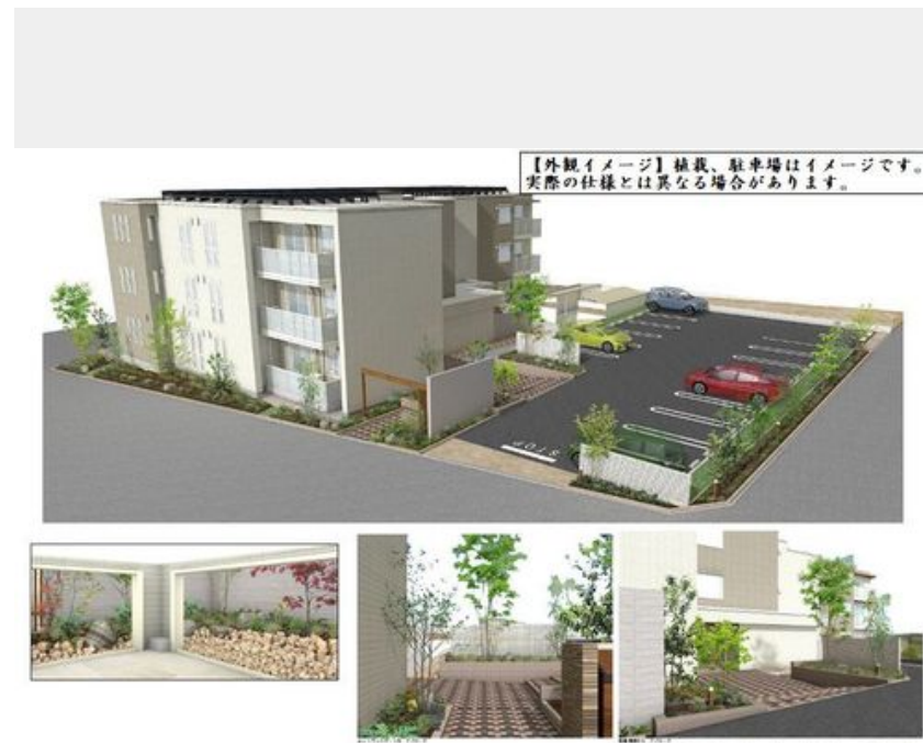
【外観イメージ】 植栽、駐車場はイメージです。実際の仕様とは異なる場合があります。