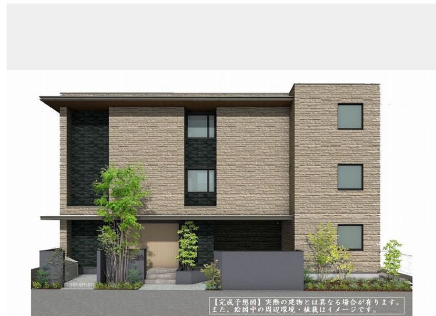
【完成予想図】実際の建物とは異なる場合があります。また、絵画中の周辺環境・植栽はイメージです。