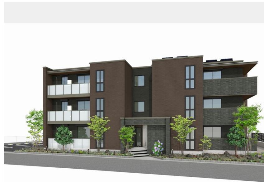
【完成予想図】実際のものとは異なる場合がございます。また、絵図中の周辺環境、植栽等はイメージです。