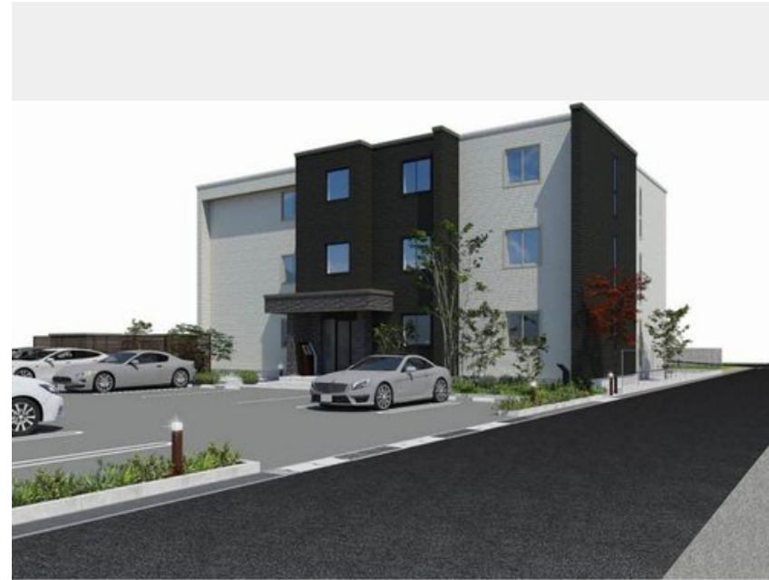
※写真は完成予想図です パースは実際の図面をもとに描き起こしたイメージで、実際のものとは異なる場合があります