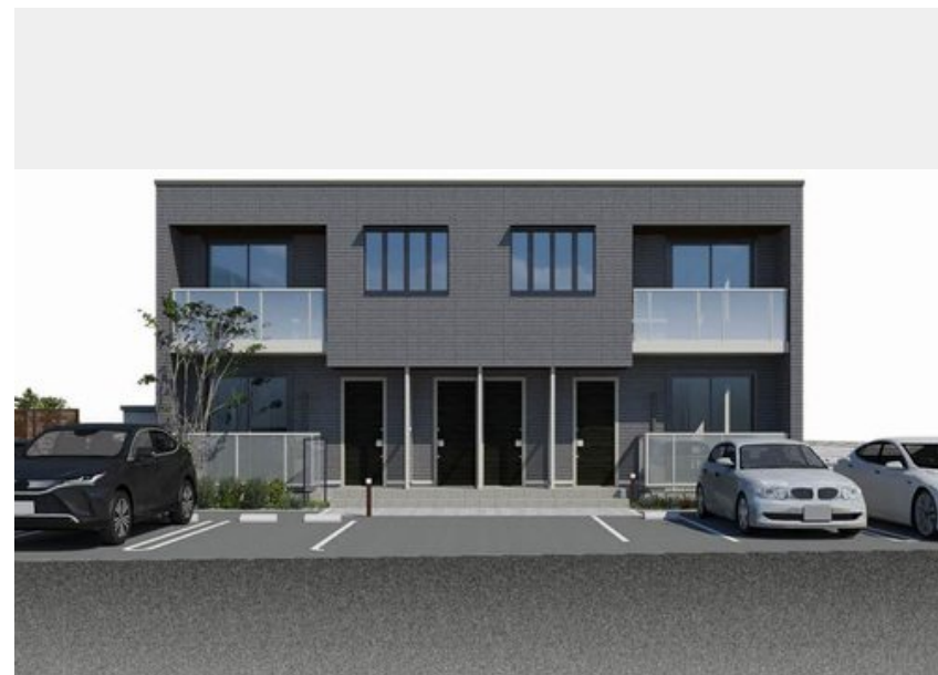
※写真は完成予想図です パースは実際の図面をもとに描き起こしたイメージで、実際のものとは異なる場合があります