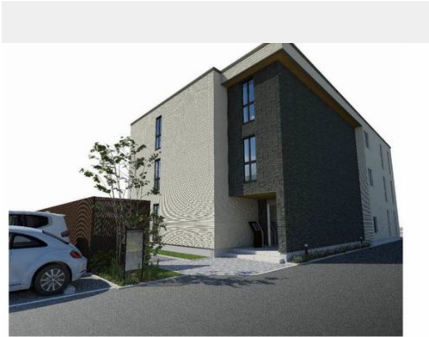
※写真は完成予想図です パースは実際の図面をもとに描き起こしたイメージで、実際のものとは異なる場合があります