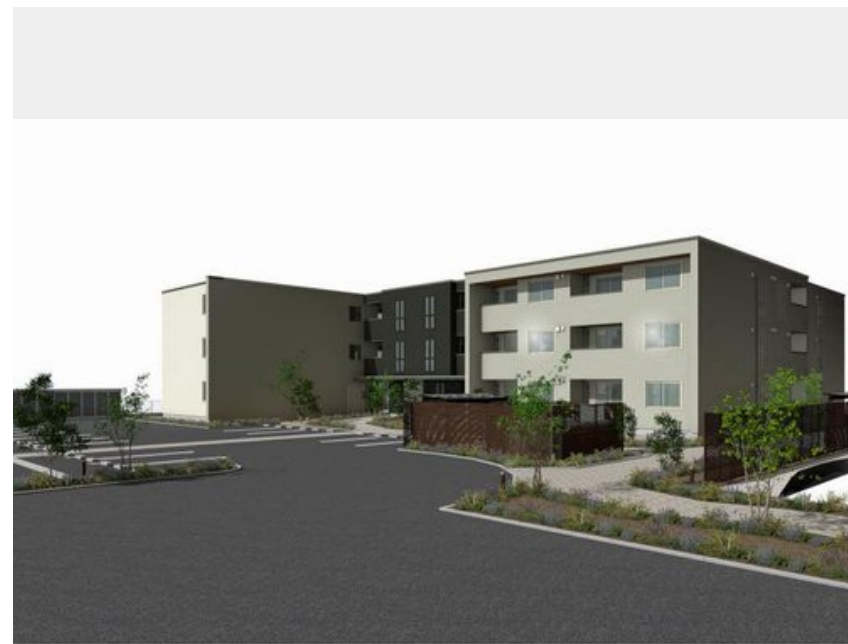
※写真は完成予想図です パースは実際の図面をもとに描き起こしたイメージで、実際のものとは異なる場合があります