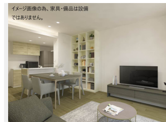
イメージ画像のみ、家具・備品は設備ではありません。