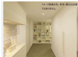
イメージ画像のみ、家具・備品は設備ではありません。