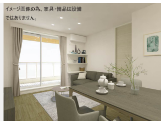
イメージ画像のみ、家具・備品は設備ではありません。