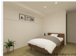
※家具・家電・内装はイメージです