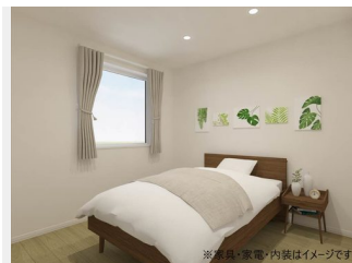
※家具・家電・内装はイメージです