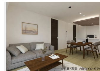
※家具・家電・内装はイメージです