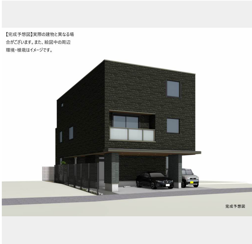
【完成予想図】実際の建物と異なる場合がございます。また、絵図中の周辺環境・植栽はイメージです。