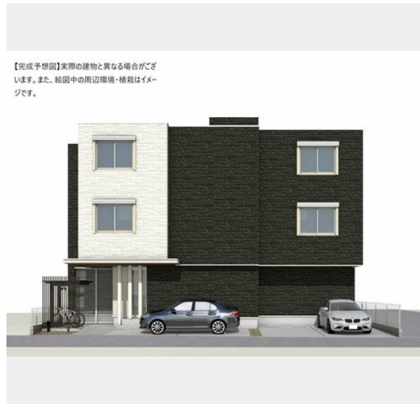
【完成予想図】実際の建物と異なる場合がございます。また、絵图中的の周辺環境・植栽はイメージです。