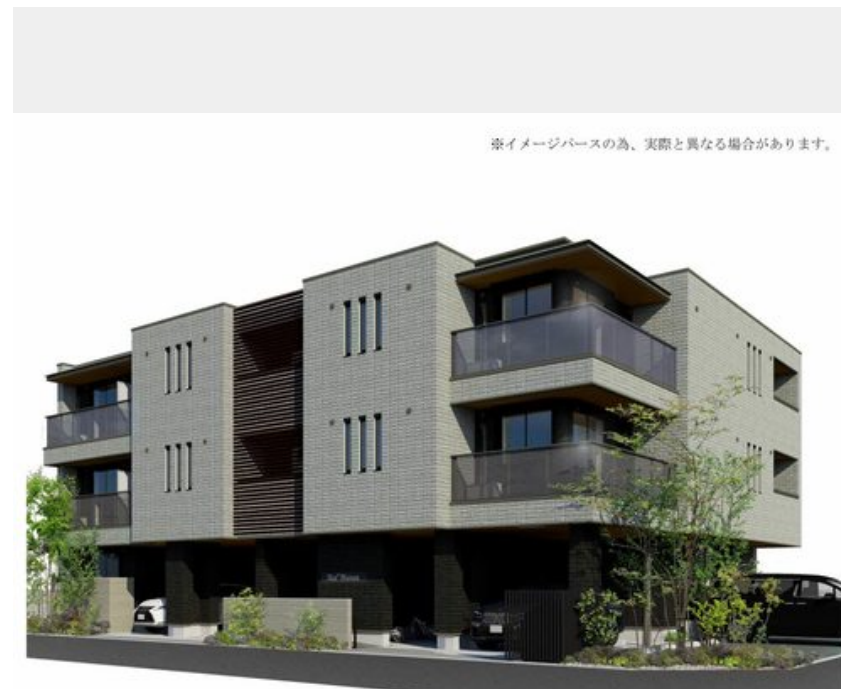
※イメージベースの為、実際と異なる場合があります。