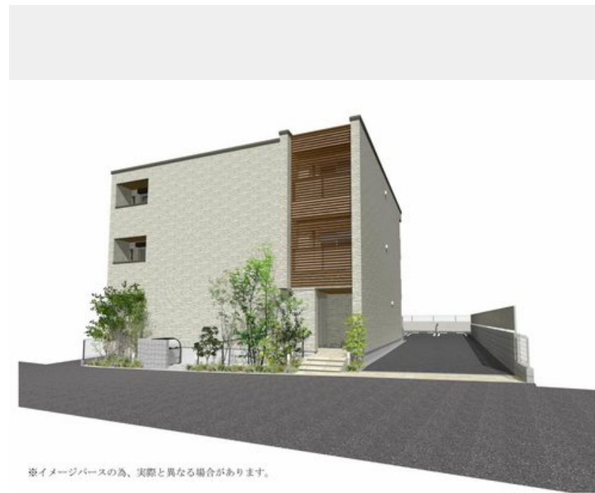
※イメージパースの為、実際と異なる場合があります。