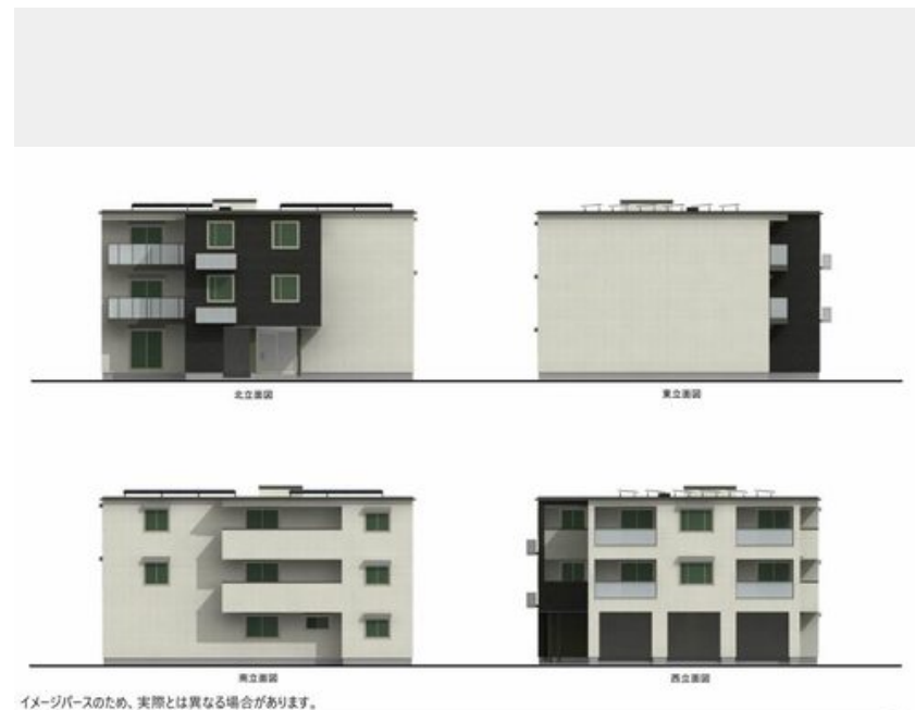
イメージのため、実際とは異なる場合があります。