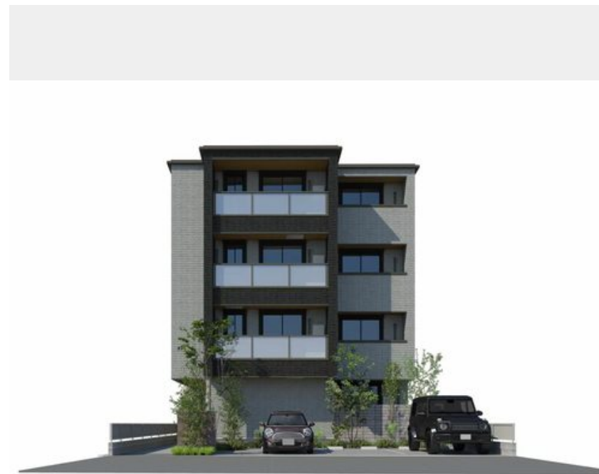
※イメージベースのため、実際とは異なる場合があります。