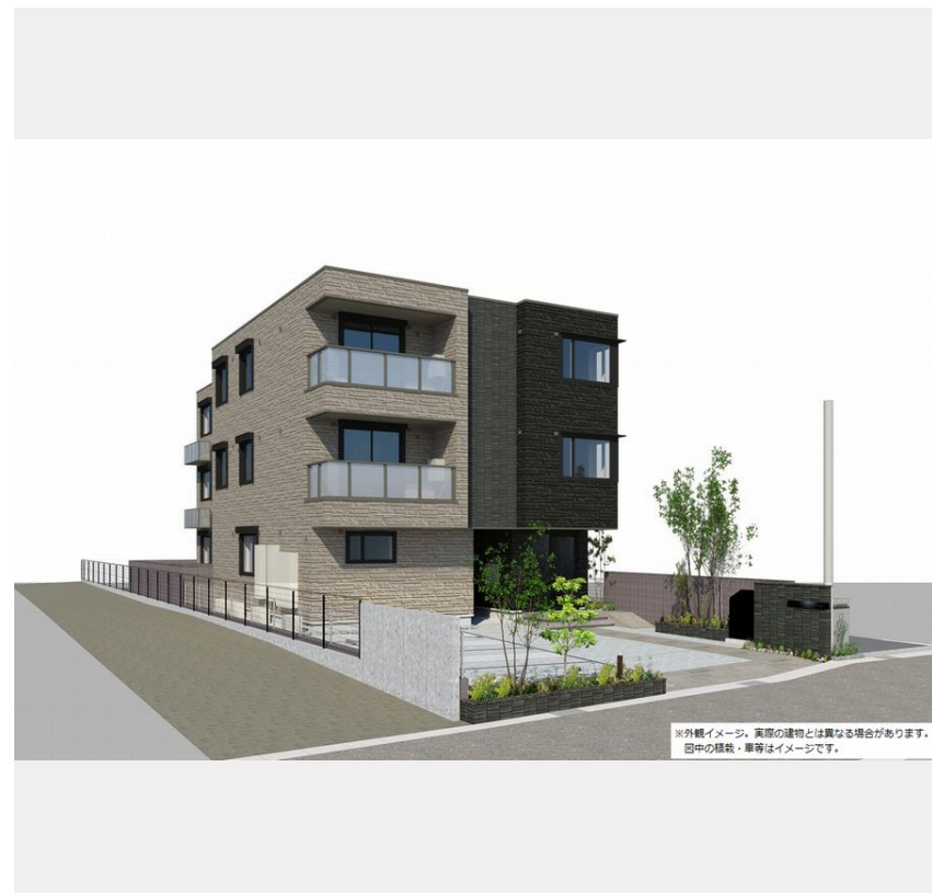
※外観イメージ。実際の建物とは異なる場合があります。目や口の位置・扉等はイメージです。