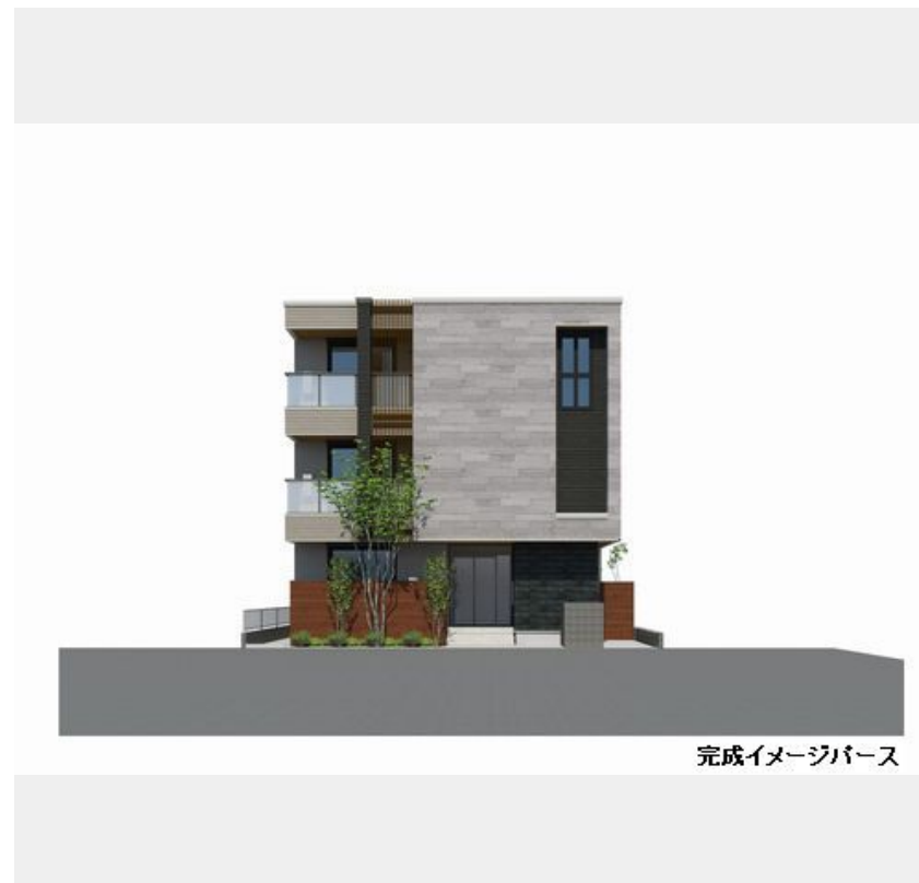
完成イメージパース