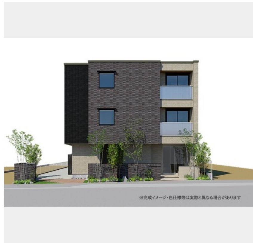
※完成イメージ・色仕様等は実際と異なる場合があります