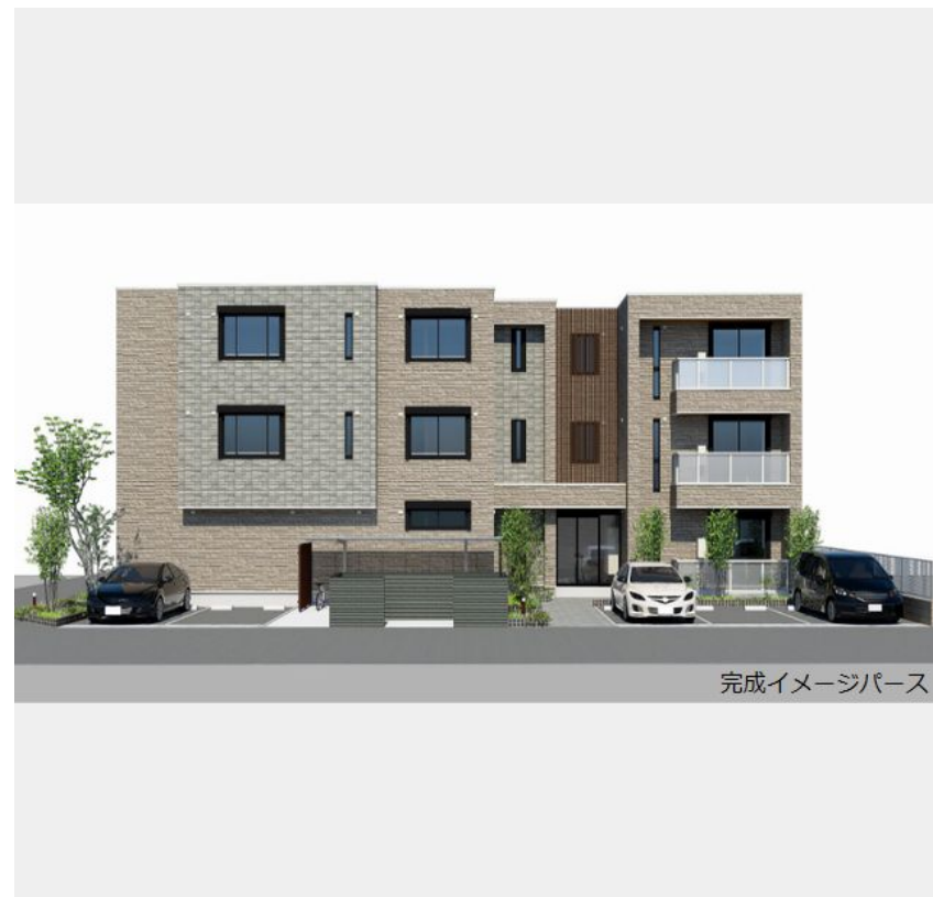
完成イメージパース