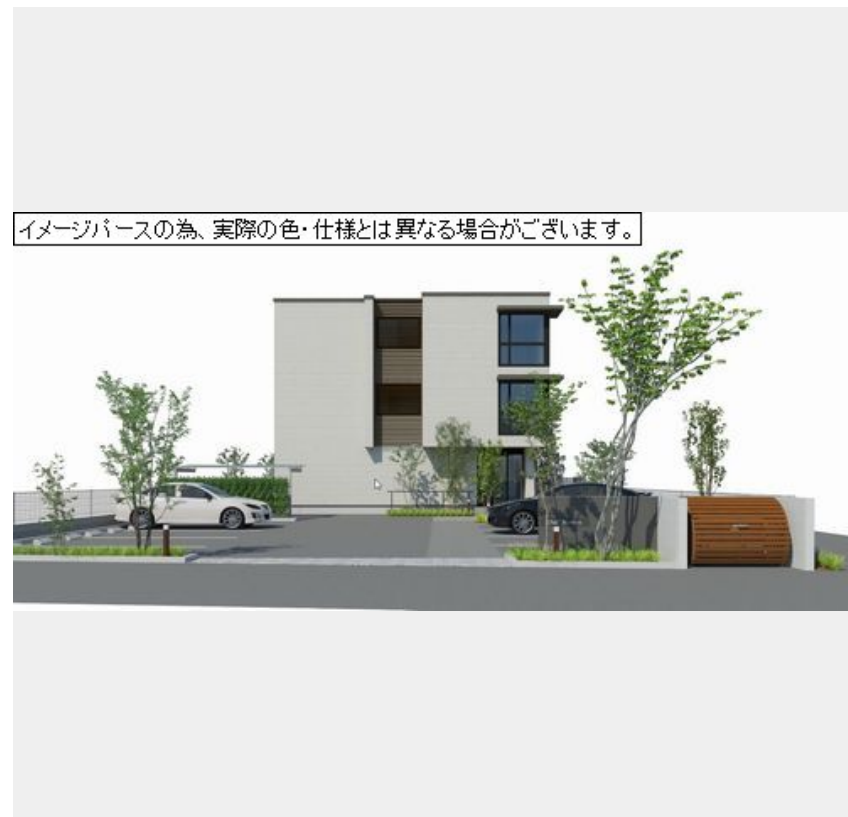
イメージパースの為、実際の色・仕様とは異なる場合がございます。