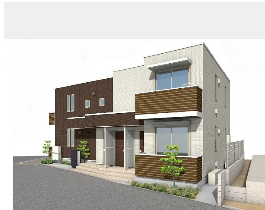
外観イメージバースです。配色、配置、仕様等変更になる場合がございます。ご了承ください。