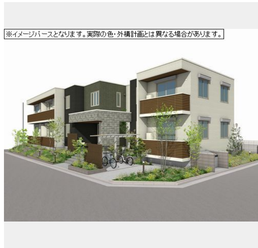
※イメージパースとなります。実際の色・外構計画とは異なる場合があります。