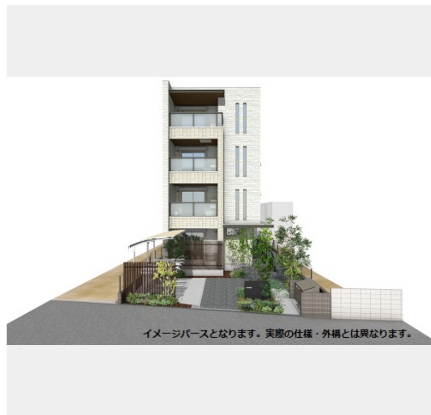
イメージパースとなります。実際の仕様・外構とは異なります。