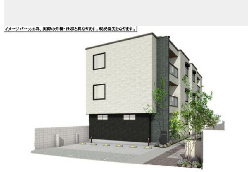
イメージベースの為、実際の外観・仕様と異なります。現況優先となります。